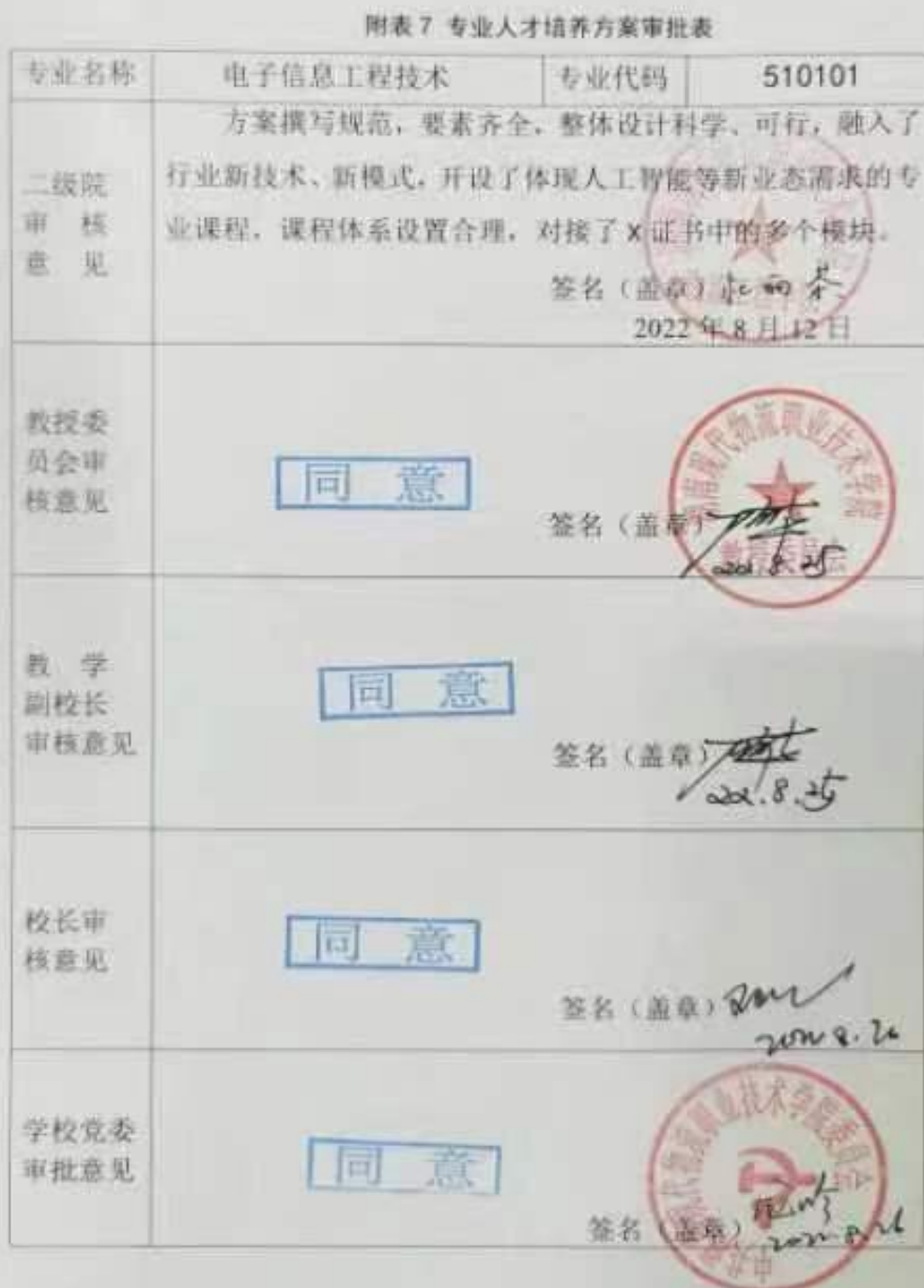
附表7 专业人才培养方案审批表