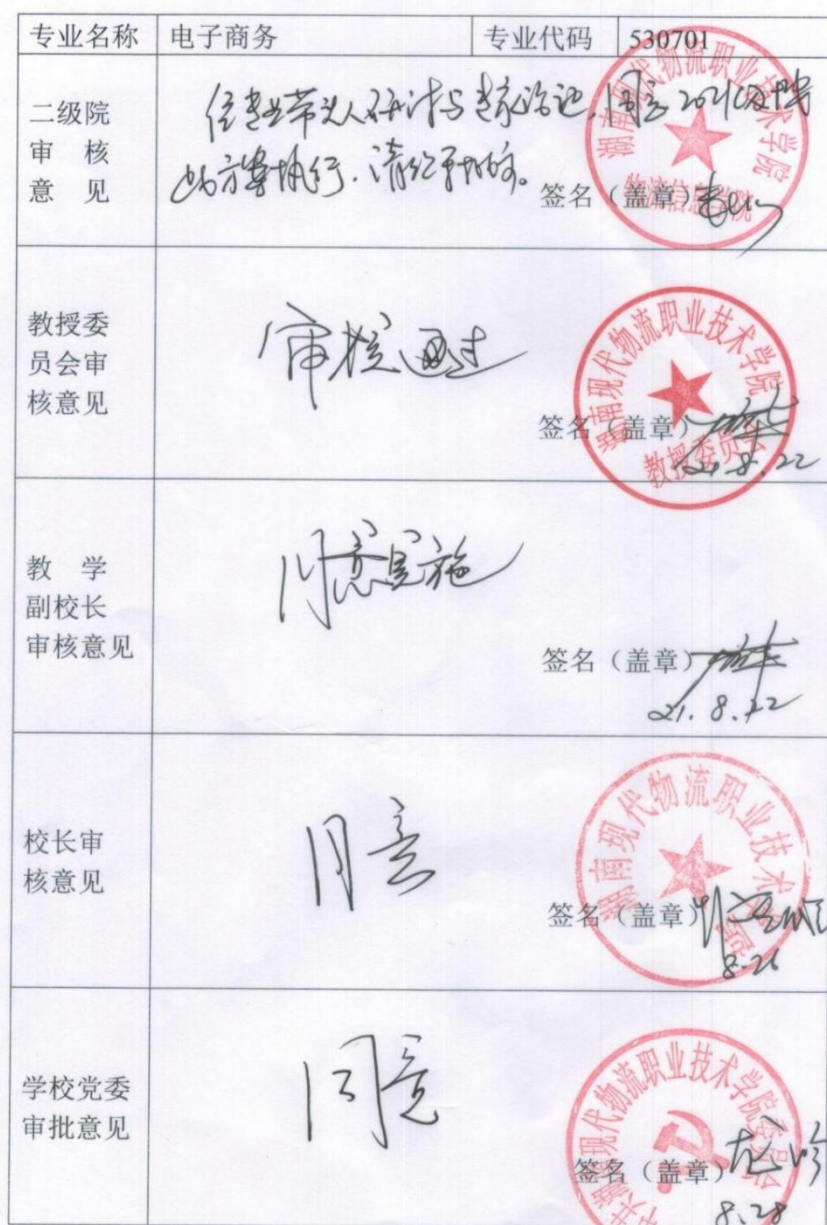
附表7 专业人才培养方案审批表