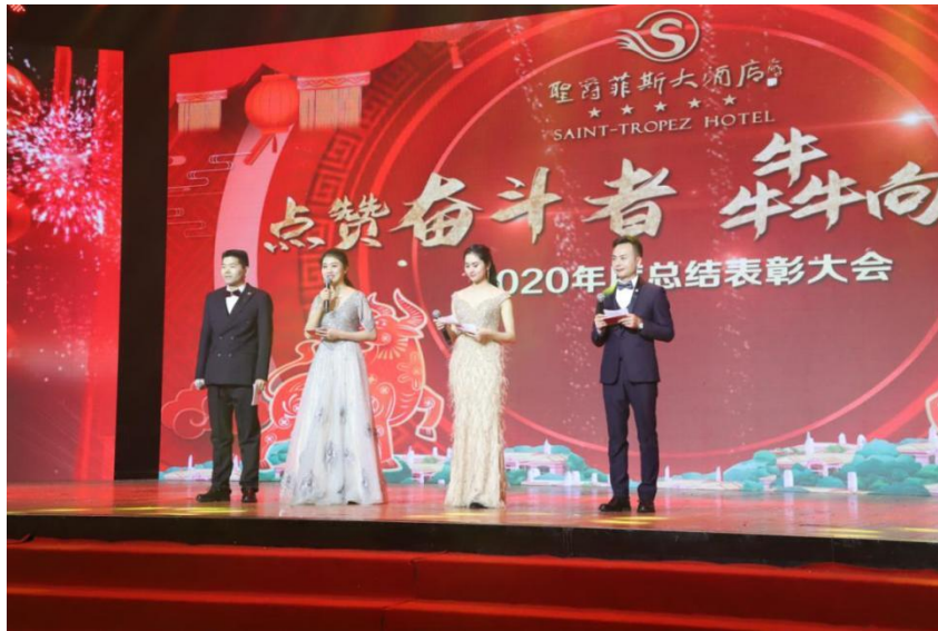
图9 2020年圣爵菲斯大酒店年度总结表彰