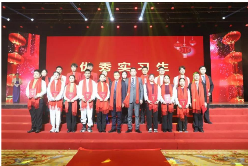
图10 2021年16名优秀实习生受酒店表彰