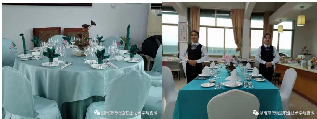
图 13 省赛获奖台面设计作品