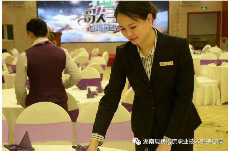
图 15 学生在酒店会场服务