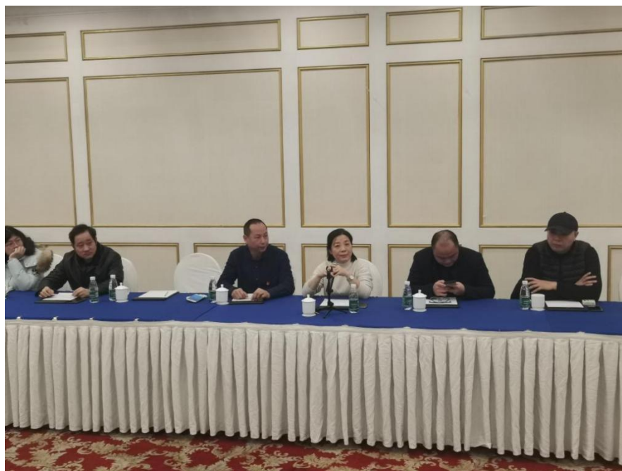
图4 2020年物流人文艺术学院领导老师对实习学生开展慰问座谈会