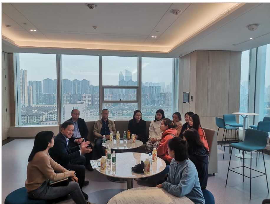
图 5 2021 年物流人文艺术学院领导老师开展慰问座谈及校企交流会