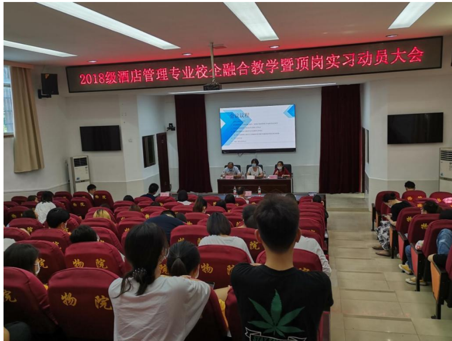
图3 2018年酒店管理专业校企融合教学暨顶岗实习动员大会