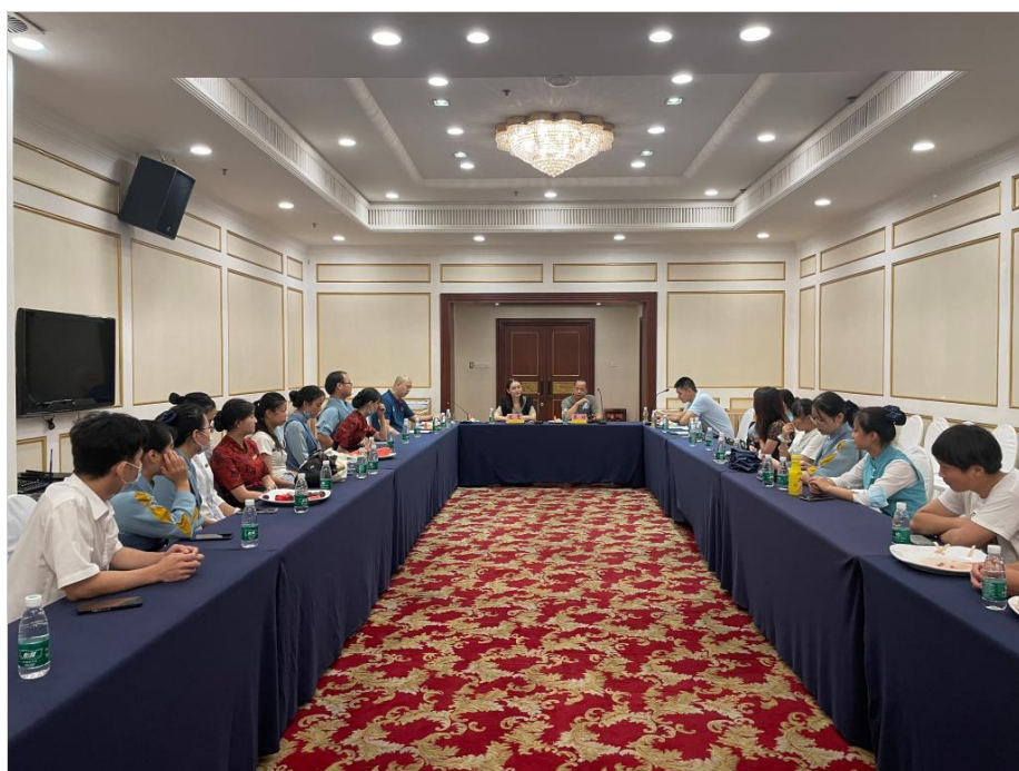
图 6 2022 年物流人文艺术学院领导老师开展慰问座谈及校企交流会