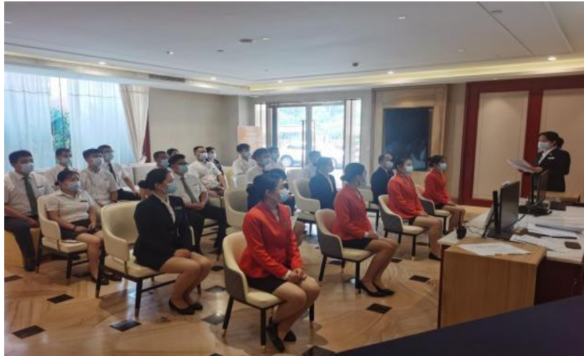
图 14 学生在实习酒店积极投身金叶级绿色旅游饭店创建工作启动

要求及知识。学生时刻践行着基本的礼节礼仪、行为举止。经过诸如此类锤炼，学生们已褪去了些许青涩，举手投足之间展现出了应有的酒店从业人员的素养，为酒店积极创建金叶级绿色旅游饭店贡献做出了重要。