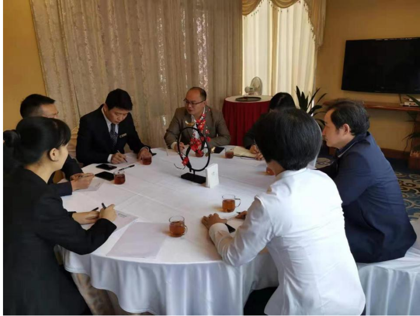
图 2 2019 年酒店管理专业人才培养方案校企论证过程