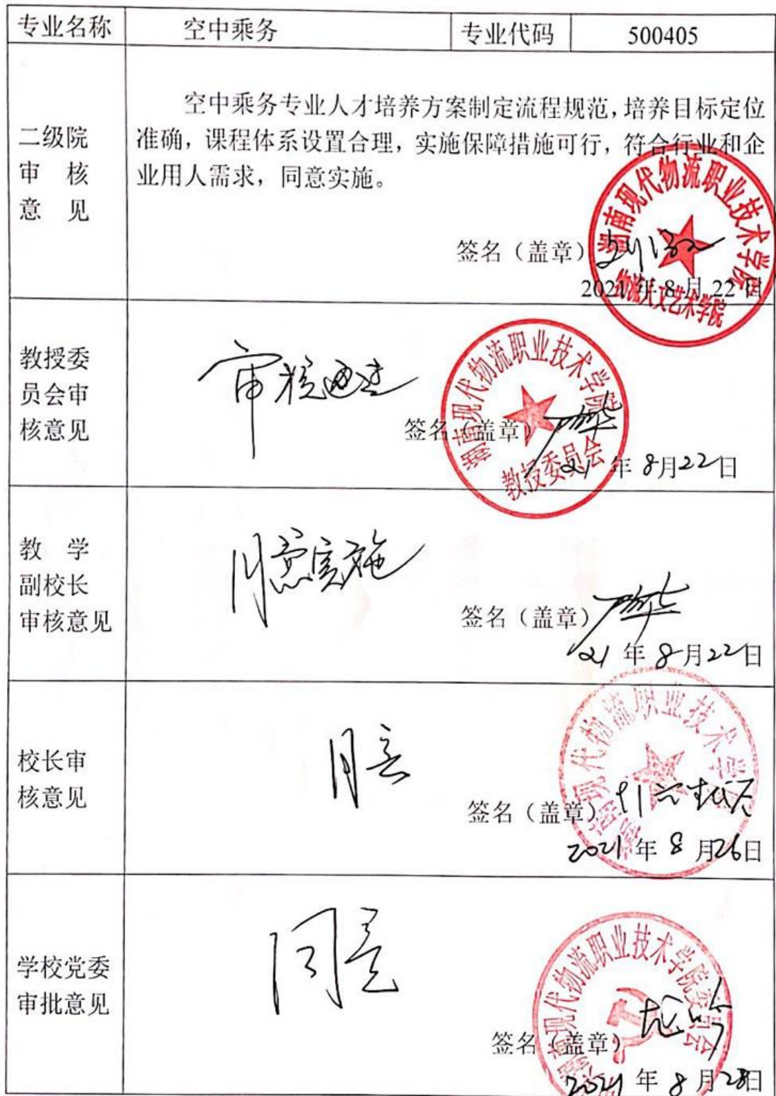
附表7 专业人才培养方案审批表