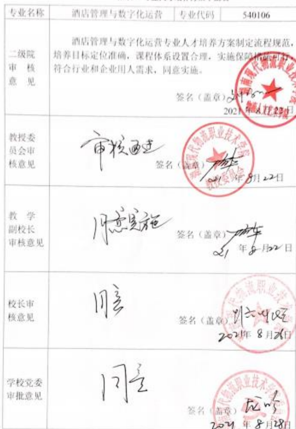
附表7 专业人才培养方案审批表