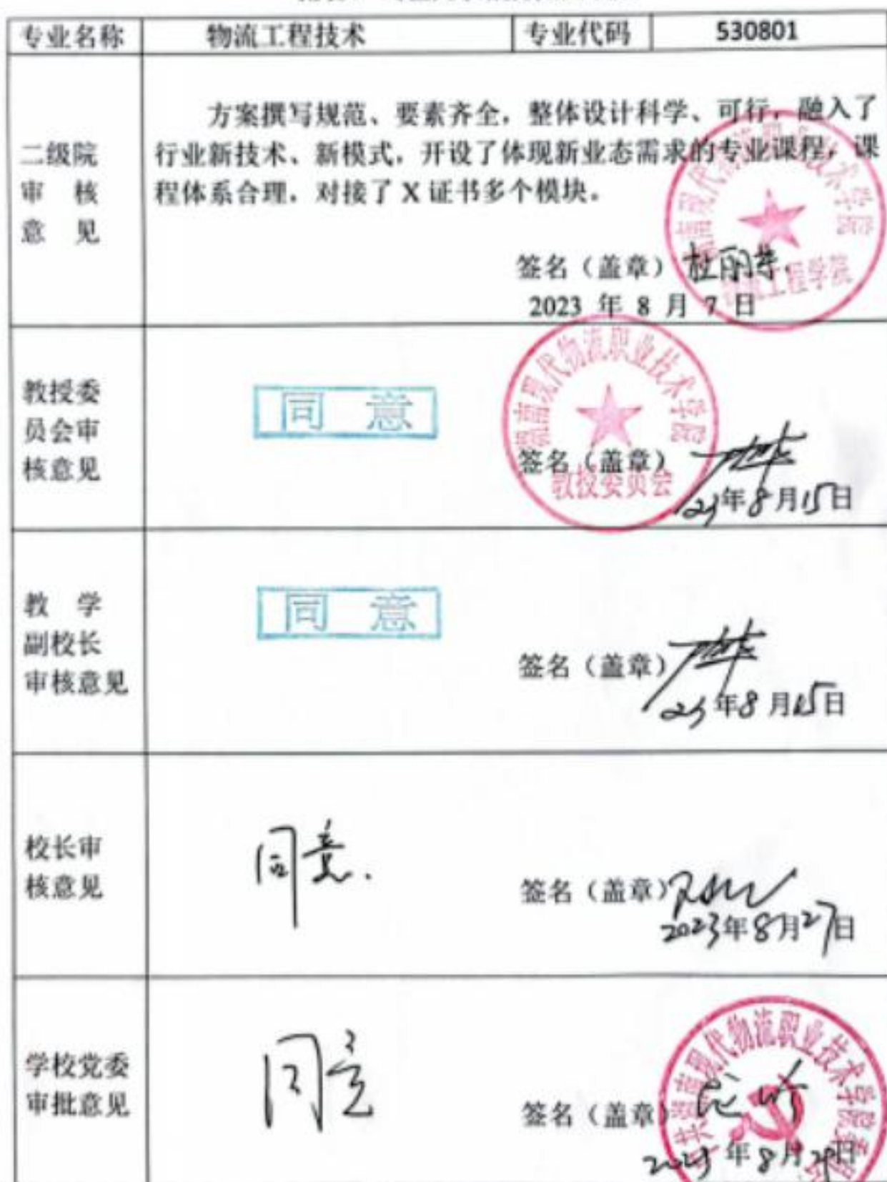
附表7 专业人才培养方案审批表